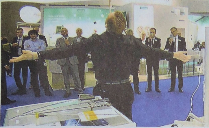
Bei Hubers Demonstrationen beim Chirurgen-Kongress in Berlin zückten die Chirurgen fasziniert ihre Handys.