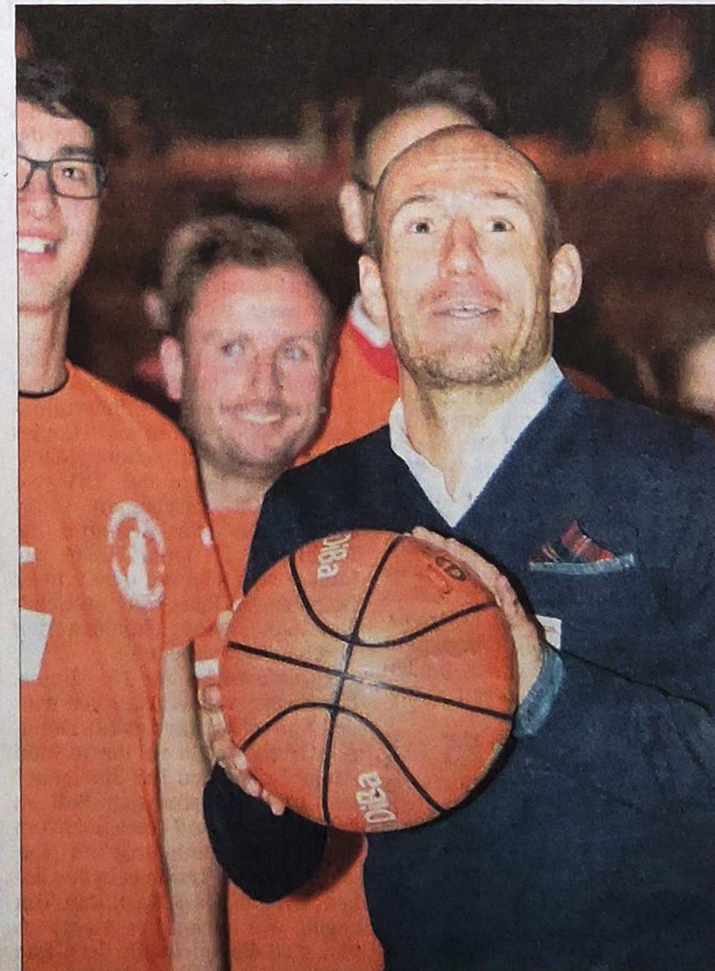
Als echter Oranje-Stürmer kann er's natürlich auch mit dem orangefarbenen Ball: Arjen Robben überzeugt in Traunstein als Basketballer.

wir ja einen Trainer und Jürgen Klopp hat auch einen Verein.“ Überraschend einen neuen Verein bekam er dann kurz darauf: Vom Nikolaus erhielt Müller nämlich ein Trikot des FC Sturm Hauzenberg und einen Vertrag für den ak-