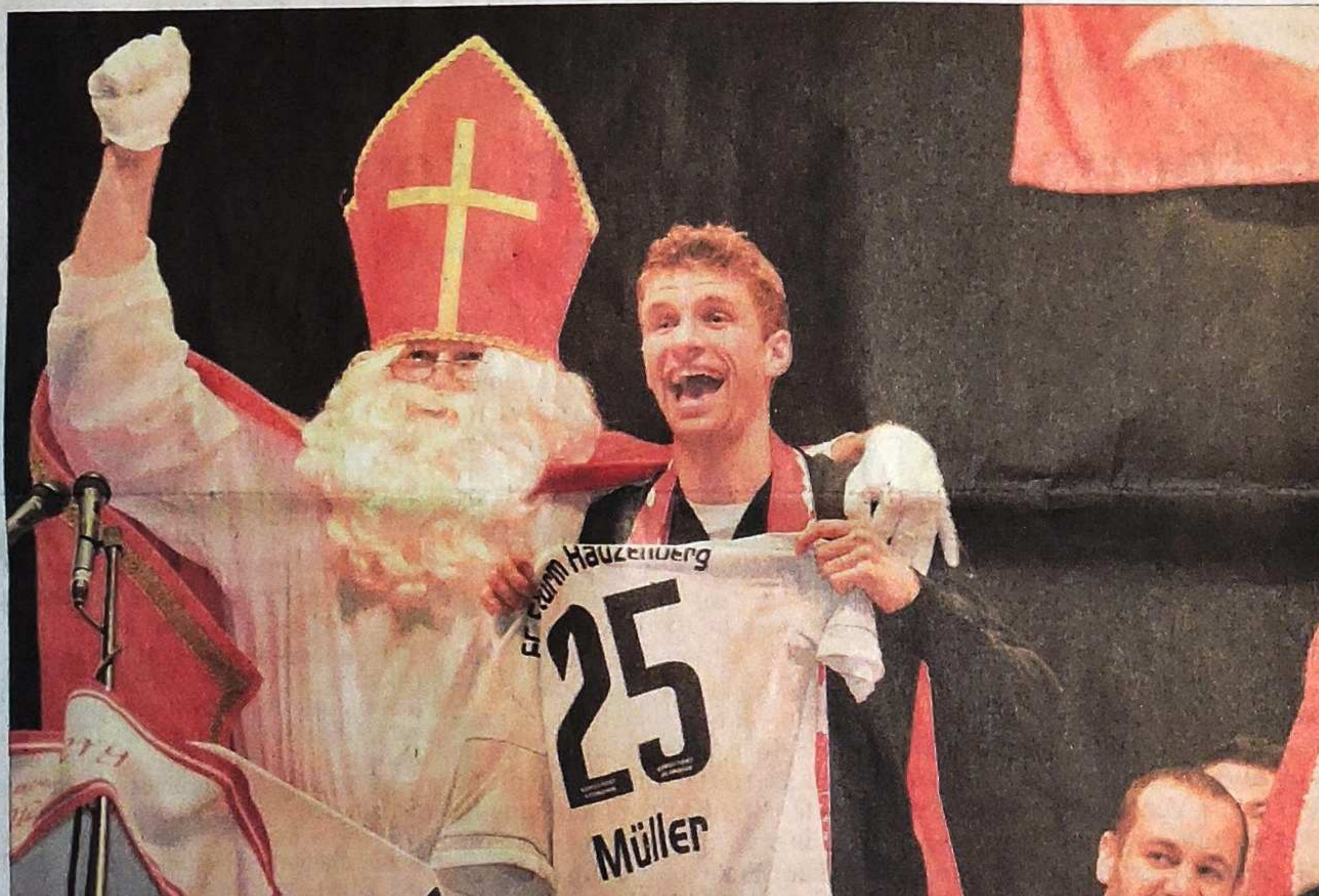
Der Nikolaus macht ihn zum Hauzenberger: Thomas Müller bekommt ein Sturm-Trikot mit der Rückennummer 25 überreicht. Der Star mit den Entertainer-Qualitäten macht den Spaß gern mit.

bereitet wurde. Sein siegreicher Champions-League-Finaltreffer 2013 wurde ausgiebig gewürdigt – mit Video-Einspielung und dem mehrmals intonierten Arjen-Robben-Südkurven Song „Ich hab geträumt von Dir, von unsrer Wembley-Nacht... der Arjen hat's gemacht“. Den europäischen Vereinstriumph zu wiederholen, das sei auch eines der Ziele für diese Saison, sagte der niederländische Nationalspieler. Er könne sich gut vorstellen, seinen 2017 auslaufenden Vertrag in München zu verlängern, sagte der 31-Jährige. Große Treffsicherheit bewies der Torjäger auch mit dem Basketball: Acht von zehn Würfen versenkte Robben im Korb der Traunsteiner Turnhalle – pro Treffer spendete der Fanclub „Rot-Weiße Traun“ 50 Euro für die „FC-Bayern-Hilfe e.V.“.