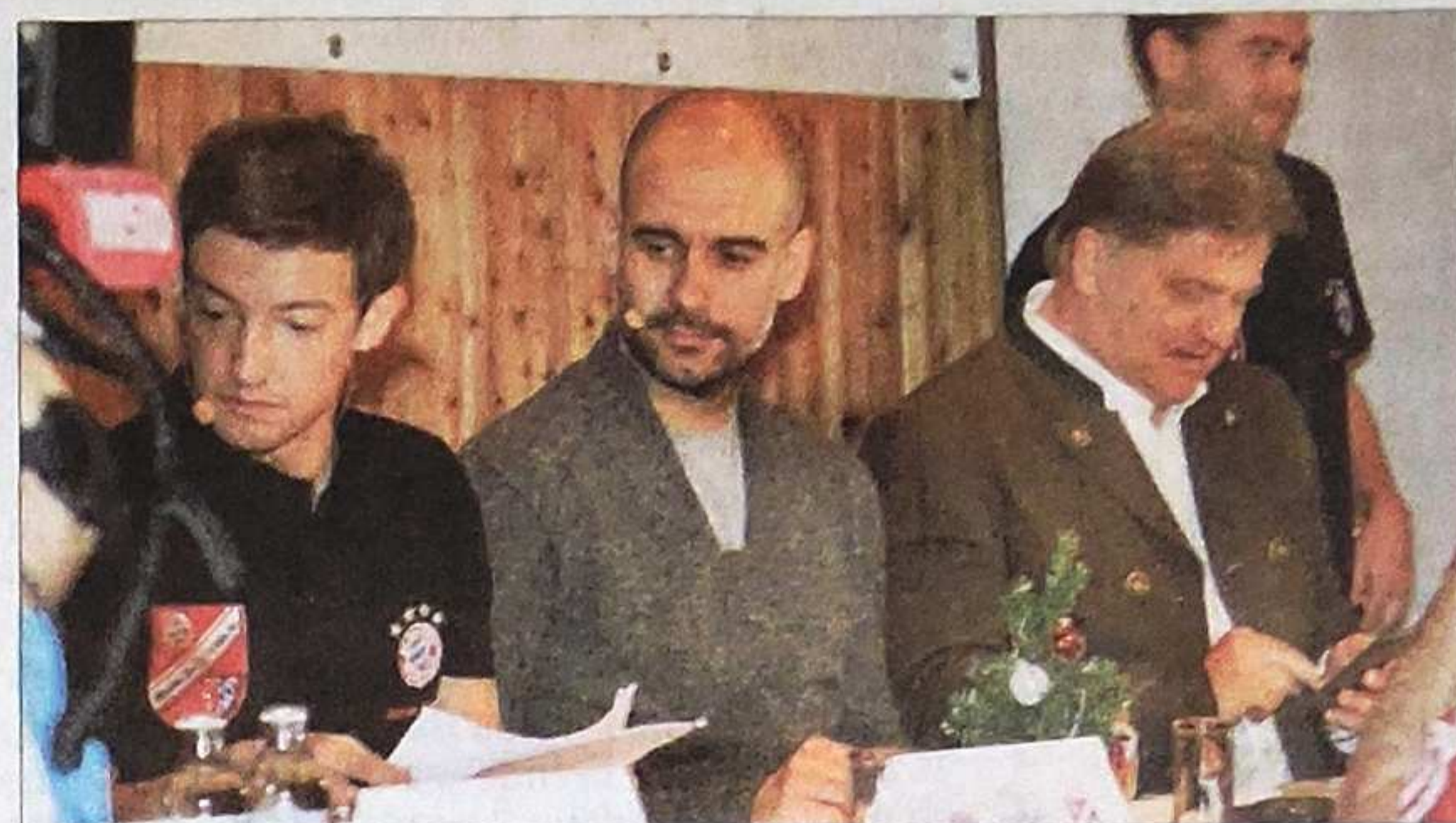
Alternative Vilsbiburg: Sollte er beim FC Bayern nicht verlängern, will der TSV Pep Guardiola einen Sechs-Jahres-Vertrag anbieten.

Garching / Traunstein / Hauzenberg / Bad Griesbach / Plattling / Vilsbiburg. Für viele Bayern-Fans war am ersten Advent schon Bescherung: Die Bayern-Profis schwärmten zu vorweihnachtlichen Besuchen zu den Fanclubs im Lande aus – und wurden gebührend gefeiert.