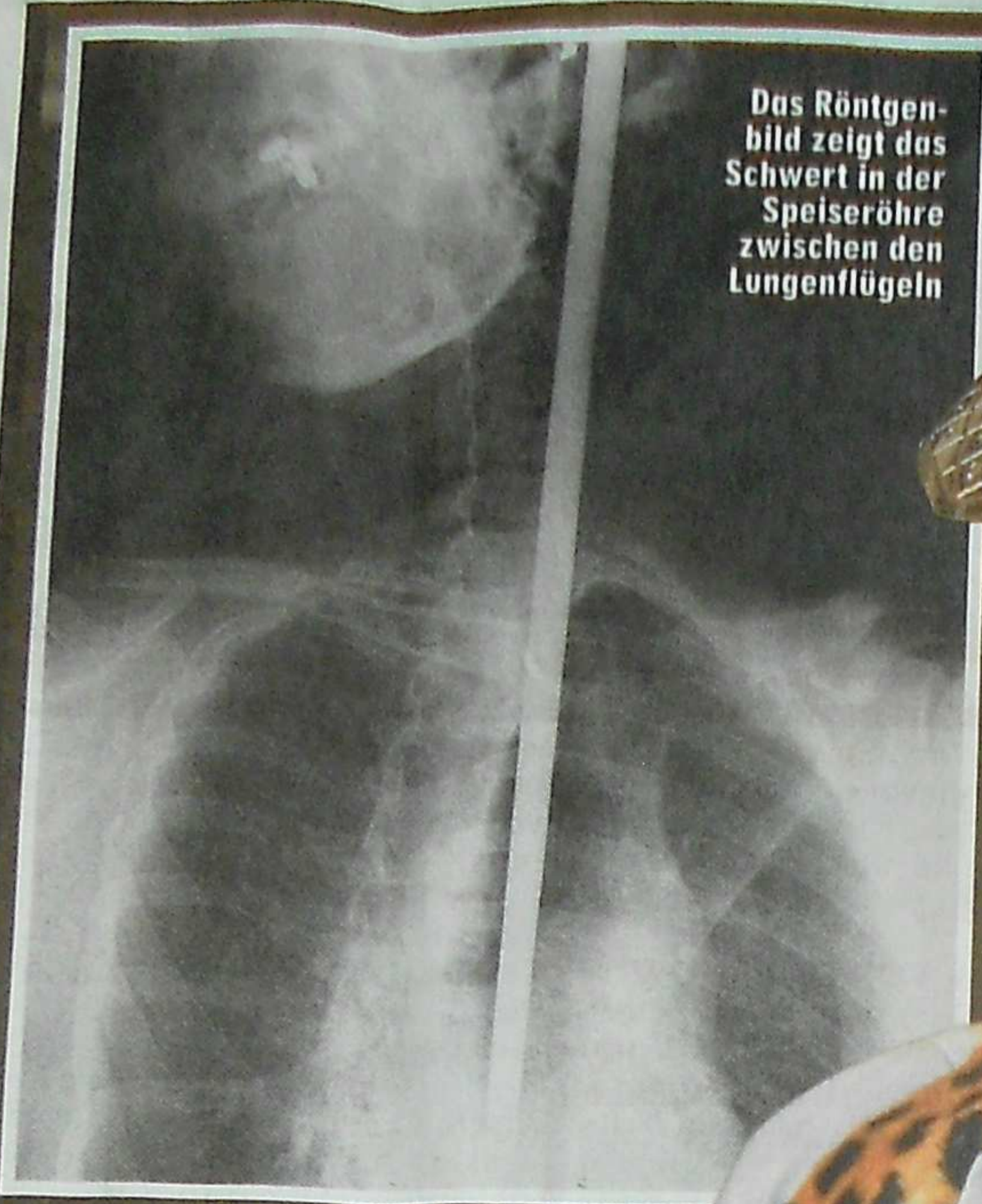
Das Röntgenbild zeigt das Schwert in der Speiseröhre zwischen den Lungenflügeln